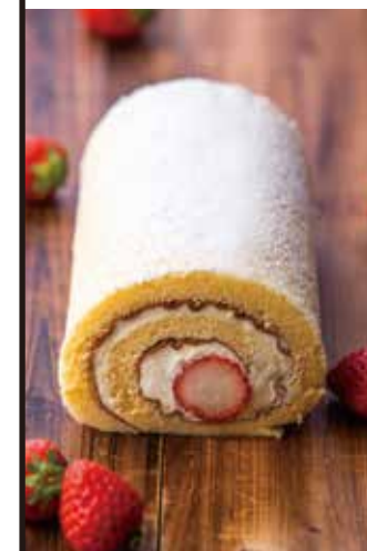
シェフ・パティシエ 日吉 正人