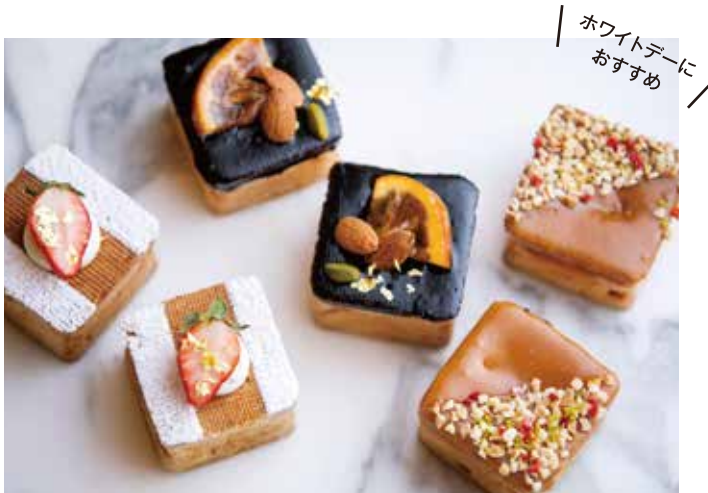
ホワイトデーに おすすめ