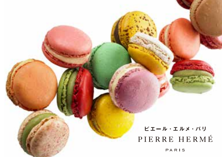
ピエール・エルメ・パリ PIERRE HERMÉ PARIS

■料金/1個 330円(イートイン) 3個 1,620円(テイクアウト) ※マカロンのフレーバーは時期により変わります。