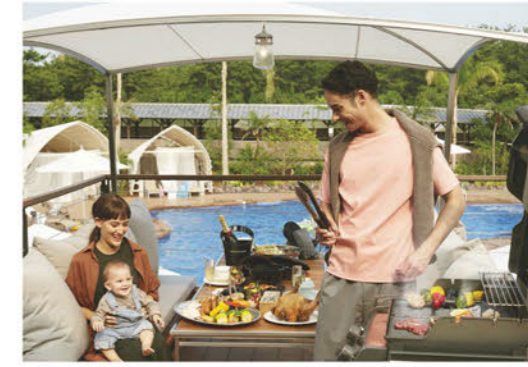
THE LIVING GARDENを眺めながら

日本一の宮崎牛は、お好みで塩コショウをし、両面に焼き色をついたらグリルの蓋を閉め焼き上げると、より美味しく仕上がります。