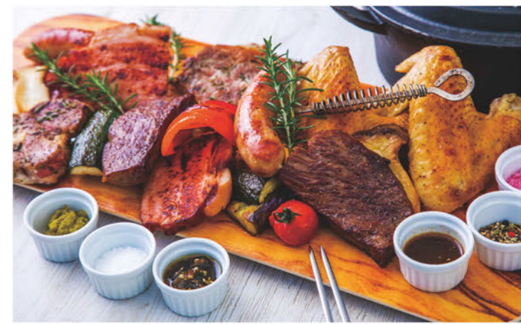
フォトジェニックでボリューム満点のメニュー