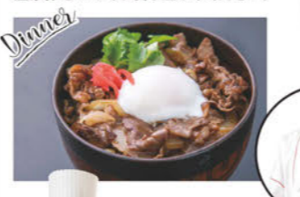
今月の宮崎牛メニュー「牛丼」

月替わりでご提供している宮崎牛メニュー。今日は、口の中でとろける上質な旨みを味わえる宮崎牛の牛丼をご用意。温泉卵をのせてお召し上がりください。