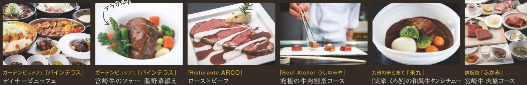
ガーデンビュッフェ「バインテラス」ディナービュッフェ ガーデンビュッフェ「バインテラス」宮崎牛のソテー 温野菜添え [Ristorante ARCO] ローストビーフ [Beef Atelier うしのみや] 究極の牛肉割烹コース 九州の米とあて「米九」 「実家 くるぎ」の和風牛タンシチュー 鉄板焼「ふかみ」 宮崎牛 肉旅コース