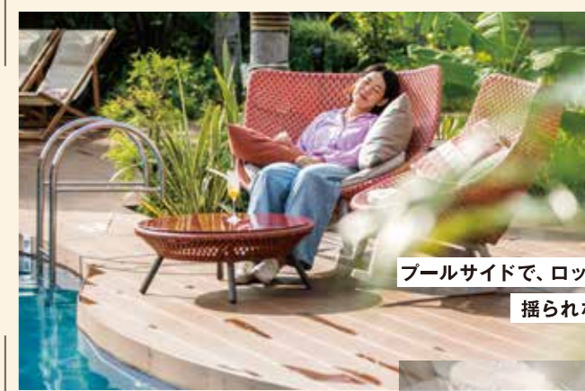
プールサイドで、ロッキングチェアに揺られながら。

せっかくの旅行だからと予定を詰め込みすぎて疲れてしまった。という経験はございませんか?リゾート内には、つい“うたた寝”してしまうほど心地よい空間がたくさん。日常を忘れ、ゆったりと。「大人を休む」贅沢な時間をお過ごしください。