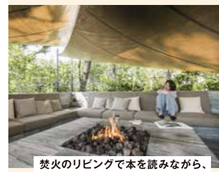
焚火のリビングで本を読みながら、揺らめく炎を見つめ、心やすらぐひととき