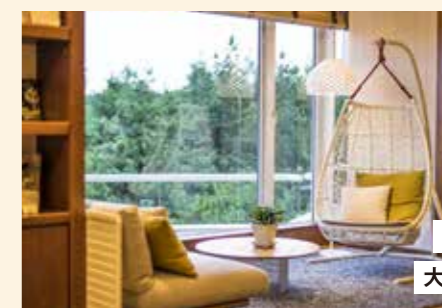
風待ちテラスでは、大きなハンギングチェアに包まれて。