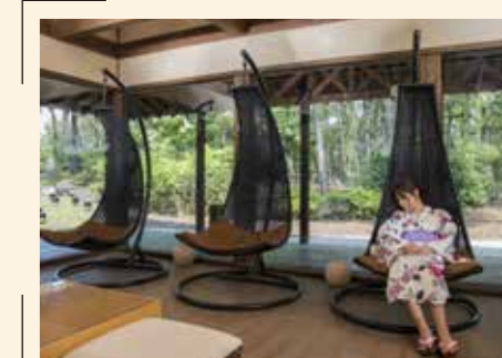
湯上りにティーテラスで、お気に入りの浴衣を着てお昼寝。