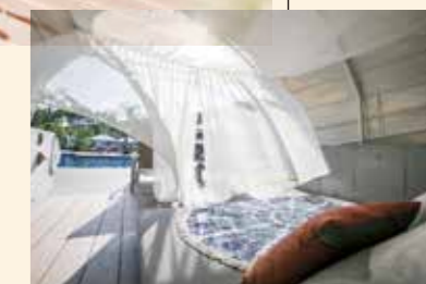
ガゼボのベッドで、キラキラ輝くプールを眺めながら。