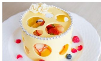
誕生日ケーキ（一例）

平日ご宿泊の場合、混雑を避けたアーリーチェックイン12：00（通常14：00） レイトチェックアウト12：00（通常11：00）が可能となります。 ※特定日は除外といたします。