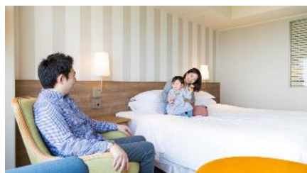
デラックスダブル (50㎡)

客室は広々とした和室や、200cmのキングサイズのベッドを備えたコーナーダブルなど選べる3タイプ。全室雄大な太平洋を望むオーシャンビューなのでリゾート気分も満点です。