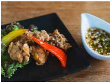
豚肉のから揚げ 油淋鶏ソース