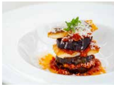
佐土原ナスとしまら真鯛の グリルガーリックトマトソース