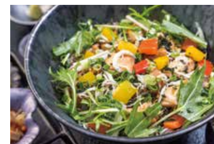
黒瀬ふりの磯バター醤油焼きと チリメンご飯