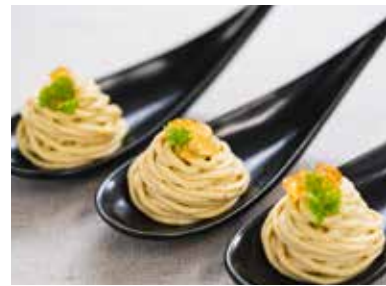
佐土原ナスの モンブラン仕立て