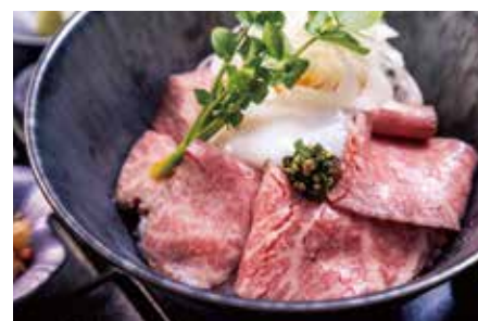
宮崎牛 ローストビーフご飯