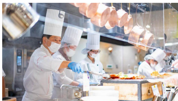
シーガイアのシェフがパインテラスに集結