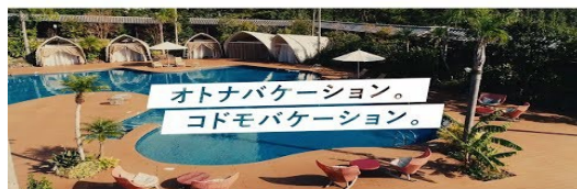
プロモーションムービー