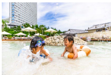
大小2つのガーデンプール