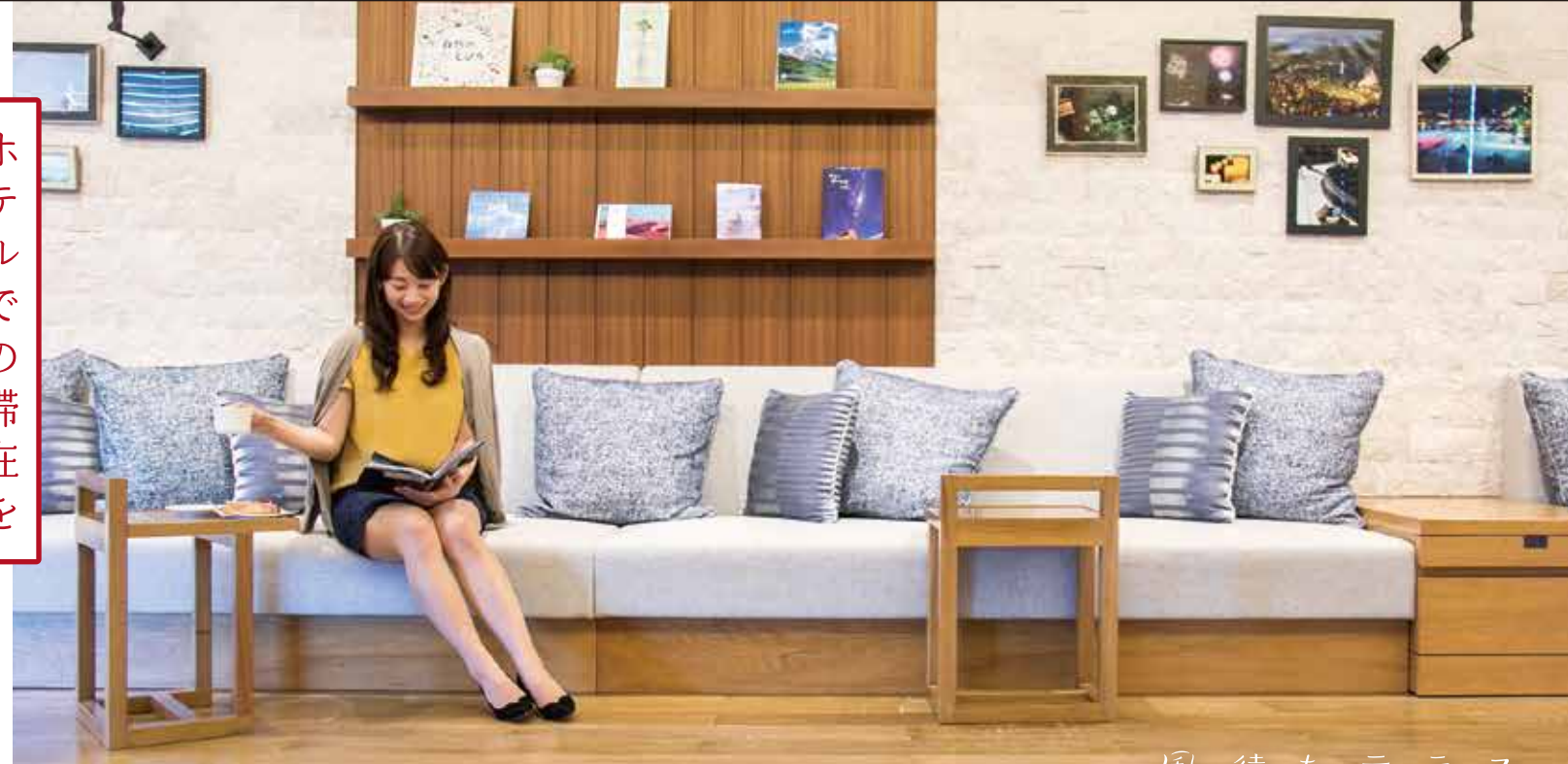
風待ちテラス KAZE-MACHI TERRACE