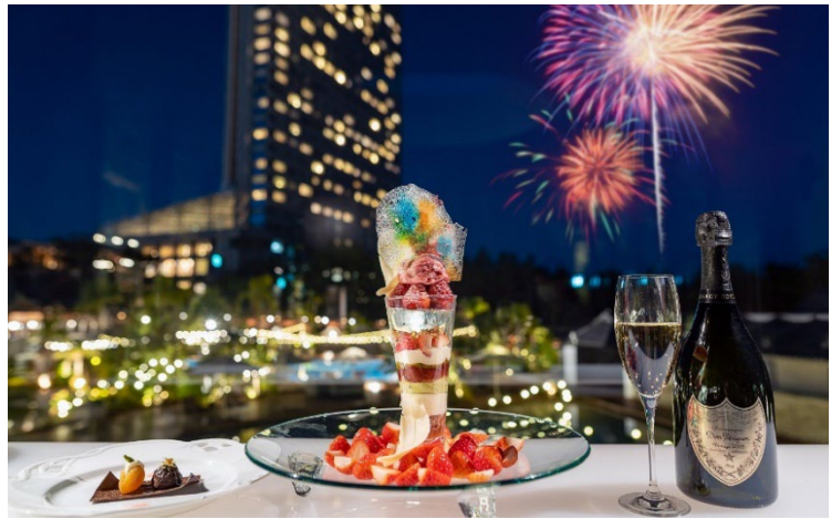
※写真は一昨年実施時のものです

▶詳細はこちら https://seagaia.co.jp/article/1166