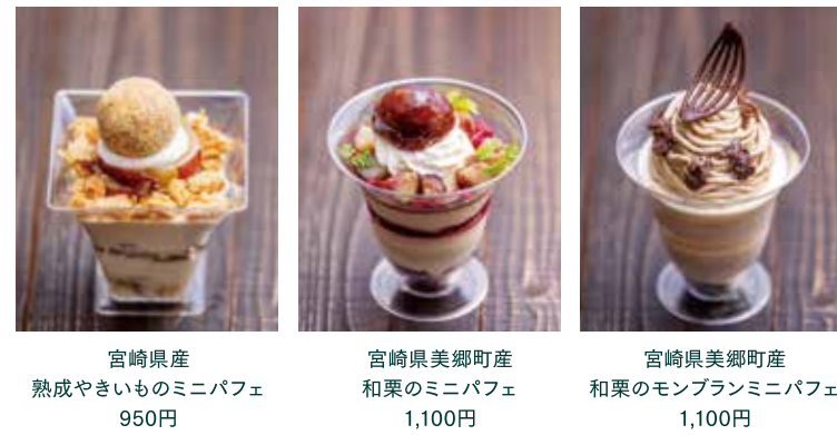
宮崎県産 熟成やさいものミニパフェ 950円 宮崎県美郷町産 和栗のミニパフェ 1,100円 宮崎県美郷町産 和栗のモンブランミニパフェ 1,100円

宮崎県産の和栗や熟成やさいもを使用した3種類のミニパフェをご用意しました。 ■期間/11月30日(木)まで