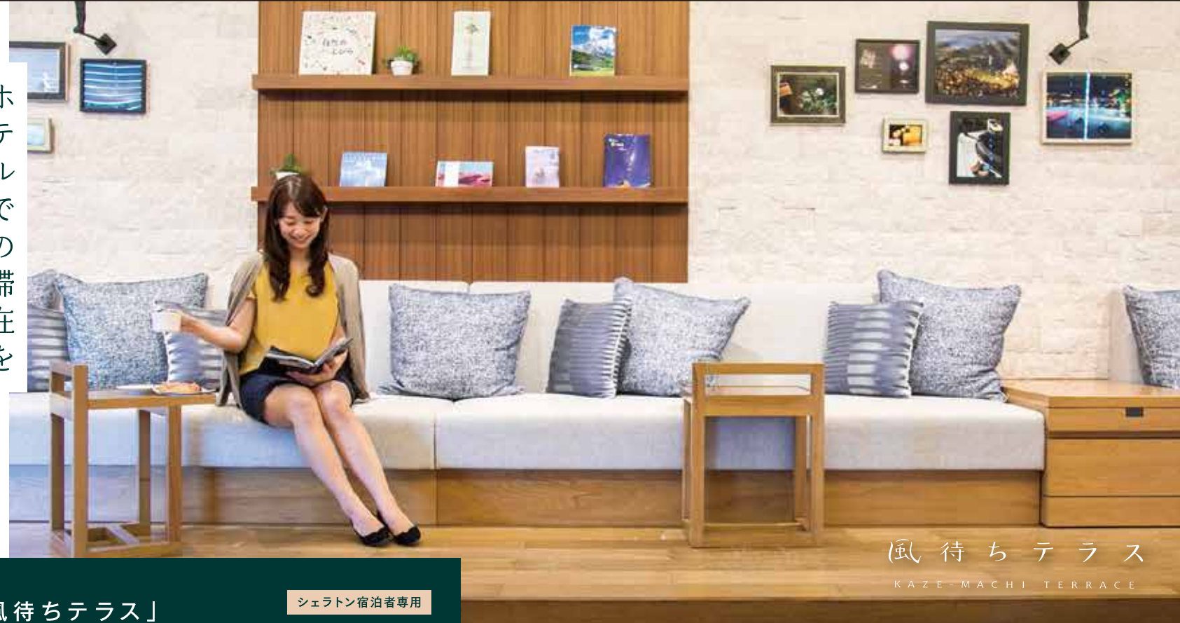
風待ちテラス KAZE-MACHI TERRACE