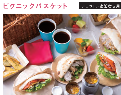
ピクニックバスケット シェラトン宿泊者専用

■期間/3月1日(水)～5月14日(日) ■場所/THE LIVING GARDEN (宿泊者専用/入場無料)