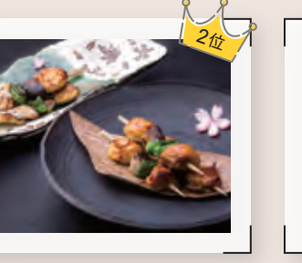
みやざき地頭鶏の味くらべ串焼き 【アクション料理部門 2位 / 三輪 勝】