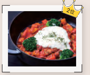
桜姫鶏のトマト煮込み チーズソースと彩り野菜添え 【肉料理部門 2位 / 中西 浩二】