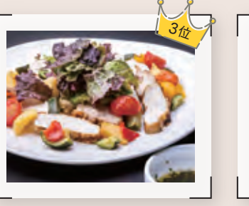
桜姫鶏のグリルディアヴォラ 【肉料理部門 3位 / 重本 幸生】