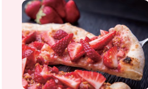
ガーデンビュッフェ「バインテラス」