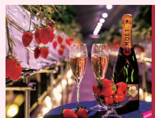
シェラトン宿泊者限定