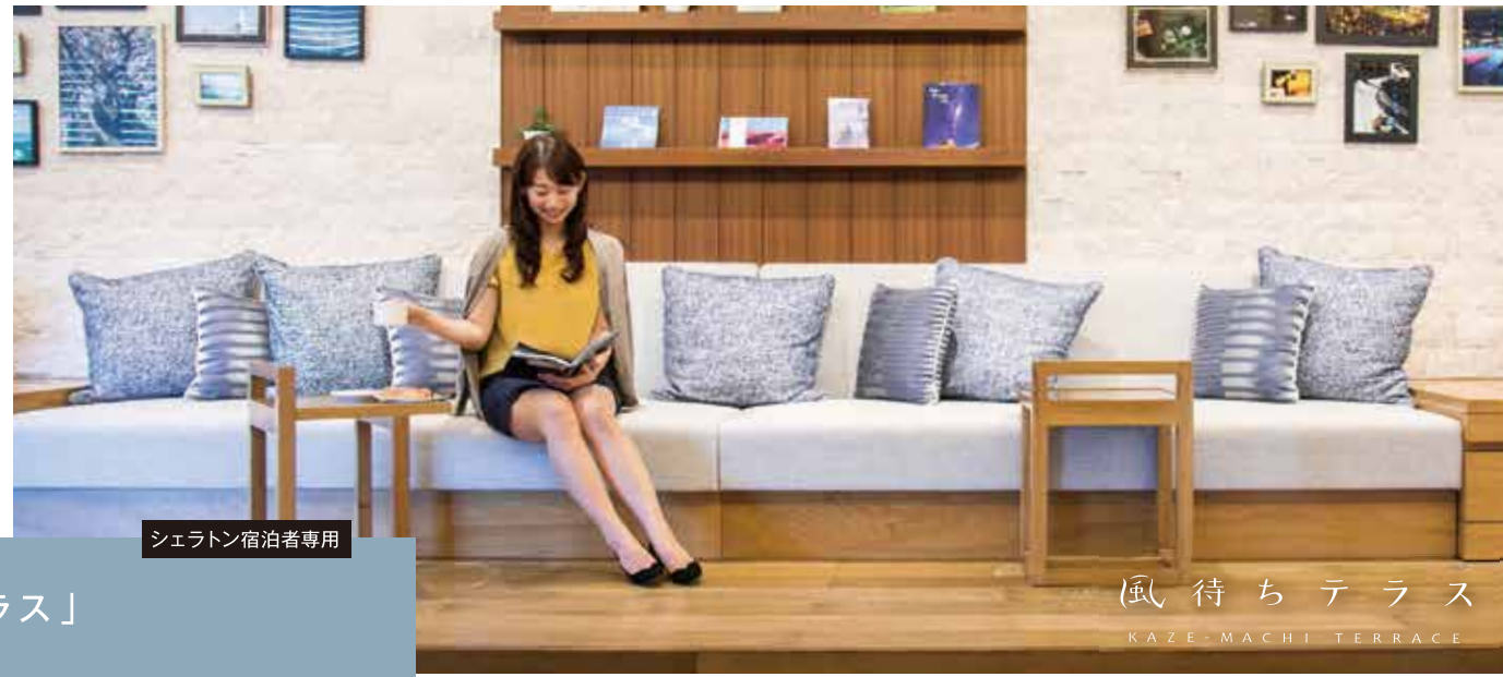
シェラトン宿泊者専用