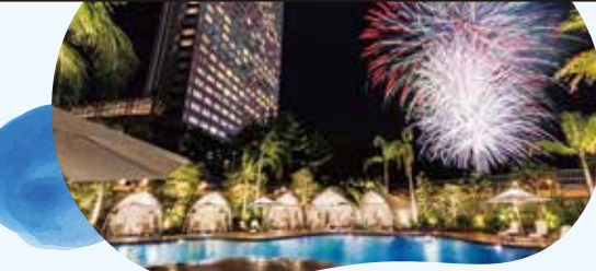
夜はプールから目の前にあがる火花を鑑賞