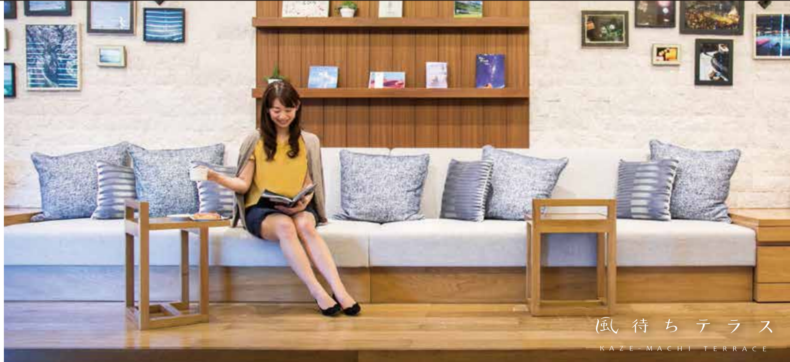
風待ちテラス KAZEMACHI TERRACE