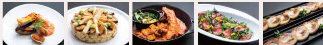
シェラトン都ホテル東京: しまら真鯛と魚介のブイヤース 横浜ベイシェラトン ホテル&タワーズ: 鮭と筍の照り焼き ベーコンのピラフ そら豆添え シェラトン都ホテル大阪: みやざきブランドポーク パーベキューソース煮と宮崎県産野菜添え 神戸ベイシェラトン ホテル&タワーズ: 宮崎牛のサラダ 神戸ワインとオレンジの香草風味ドレッシング シェラトン・グランデ・オーシャンリゾート: みやざき地頭鶏のガランティヌ

「宮崎テロワール」(宮崎の土地が育んだ地元食材の美味しさ)をテーマに、宮崎牛も肉のローストビーフや石窯で焼き上げるモチモチ生地の手作りピッツァ、色とりどりの野菜やサラダが並ぶサラダバー、冷や汁などの宮崎郷土料理など、多彩なビュッフェ料理を心ゆくまでお楽しみいただけます。さらに、シェラトン・グランデ・オーシャンリゾートを含む、国内5つのシェラトンホテルのシェフが考案した特別な料理5種をご用意しました。