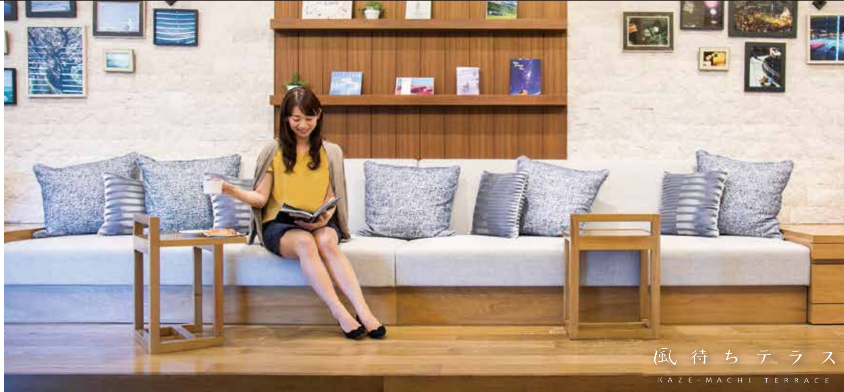
風待ちテラス KAZE-MACHI TERRACE