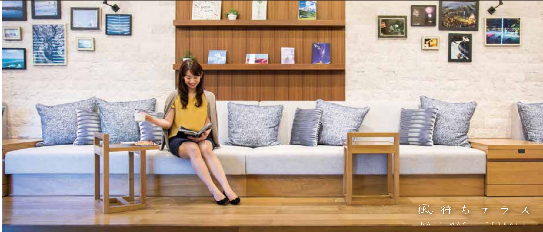
風待ちテラス KAZE-MACHI TERRACE