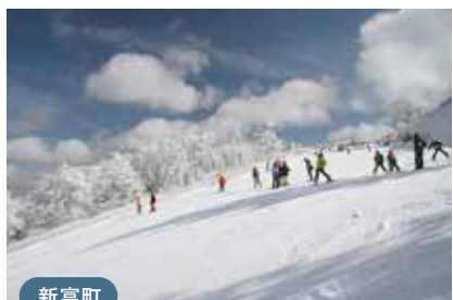
新富町 五ヶ瀬ハイランドスキー場

日本最南端の天然雪スキー場で、ドライパウダーの上質な雪が降り積もります。最上部は最高1,610m、ゲレンデから望む阿蘇や九重の大パノラマは絶景です。