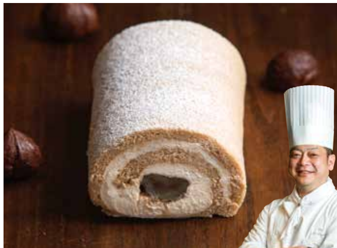
シェフ・パティシエ 日吉 正人