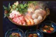
1F 米 九