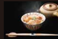
1F 実家 くらぎ

ランチご利用時、SPMCバリューポイント2倍付与いたします。 ■期間/9月30日(木)まで ※米九、実家 くらぎを除く