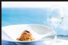
42F Ristorante ARCO