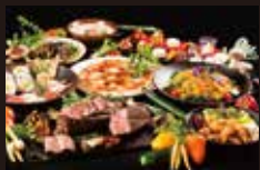
1F ガーデンビュッフェ 「パインテラス」