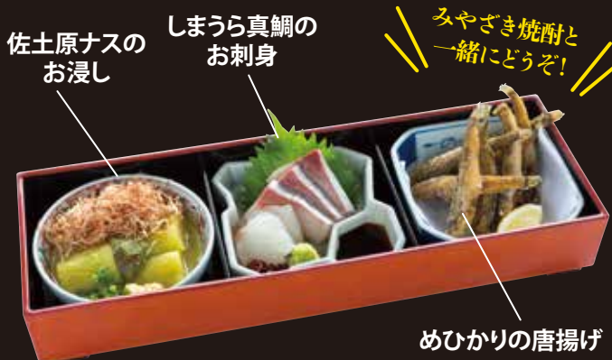
佐土原ナスのお浸し しまうら真鯛のお刺身 みやざき焼酎と一緒にどうぞ! めひかりの唐揚げ 宮崎づくし3点盛り Miyazaki Delicacies ¥1,600