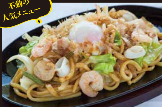
不動の 人気メニュー ※追加200円で白ご飯がセットになります 焼きうどん Fried Udon ¥1,600