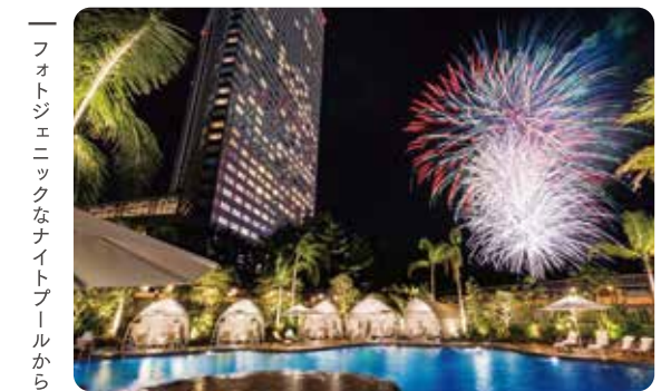
フोटोजェニックなナイトプールから