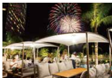
バーベキューを楽しみながら花火鑑賞!

■時間/17:30~21:30(LO) ■料金/お一人様 7,000円 ■予約/TEL.0985-21-1135 ※当日15:00までの予約制 ※雨天時は営業いたしません ※1日3組限定 ※お客様ご自身で焼いていただくスタイルです。