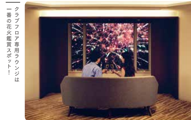
クラブフロア専用ラウンジは 一番の花火鑑賞スポット!

■期間/8月29日(土)まで ■時間/20:00~(約3分間) ※日程や時間は天候や諸事情により、変更となる場合がございます。