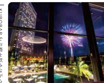
KUROBARでお酒を飲みながら