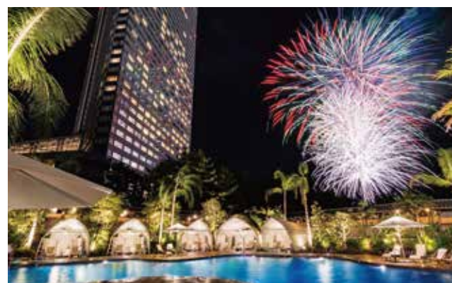
夜はプールから目の前にあがる花火を鑑賞